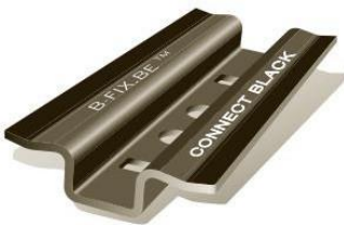
B-fix Connect (matzwart)

De B-fix One is de standaard tussen clip van B-fix. De B-fix One is een demontabel bevestigingsclip gemaakt van RVS voor hardhouten planken. De clips zijn in messing & matzwart verkrijgbaar en worden per 100 stuks verpakt, inclusief zelftappende schroeven en bijpassend bit.