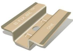
B-fix One (messing)

De B-fix One is de standaard tussen clip van B-fix. De B-fix One is een demontabel bevestigingsclip gemaakt van RVS voor hardhouten planken. De clips zijn in messing & matzwart verkrijgbaar en worden per 100 stuks verpakt, inclusief zelftappende schroeven en bijpassend bit.